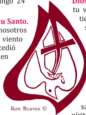
Ron Reaves ©

Dios obra en nosotros suavemente cuando acudimos a él en oración y sinceramente deseamos seguirlo. No cambiaremos de un día para otro y, algunas veces, nos preguntamos si cambiaremos aunque sea en algo. Después de todo, tenemos muchos hábitos que nos juegan en contra. Pero Dios nos ama y le pertenecemos, y nunca deja de llamarnos a su lado.